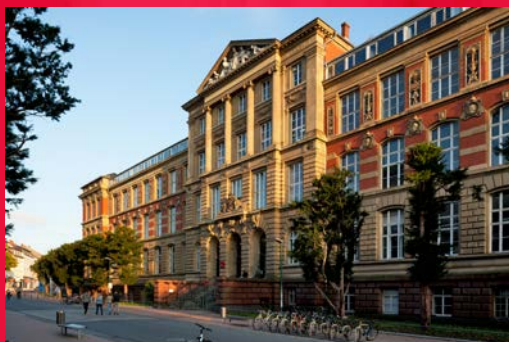
Thomas Ott / TU Darmstadt